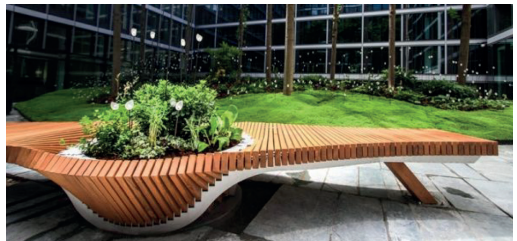
Banc BOTANIC TWIST, La Tôlerie Forézienne, design Alexis Tricoire

“Photography is a media that reveals an imaginary reality. Classified in contemporary art, it became popular with our devices and is accessible to everyone with smartphones today. But photography stays a creative media when it seizes an extraordinary situation..” Anne-Marie Sargueil, curator of EXPLORE and president of IFD.